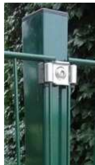
Zaunpfosten DS Eko u. DS 200