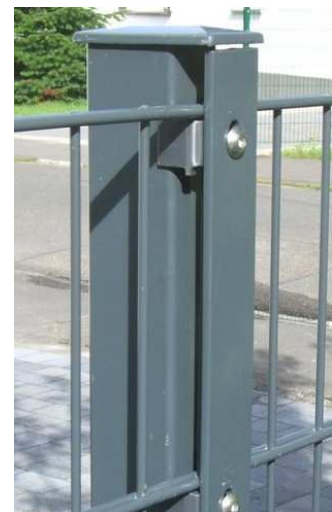
Zaunpfosten DS Premium 656, DS Profi 868 u. Schmuckzaun

Anwendungstechnische Empfehlungen sind unverbindlich. Keine Gewährleistung für Irrtümer und Druckfehler, Änderungen vorbehalten.